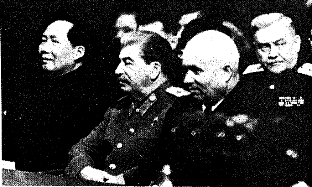
آخر أيام ستالين، أثناء استقباله ماو تسي تونغ في أول زيارة له إلى الاتحاد السوفييتي، ويبدو في الصف الأول خروتشوف وفي الصف الثاني بولغاين.